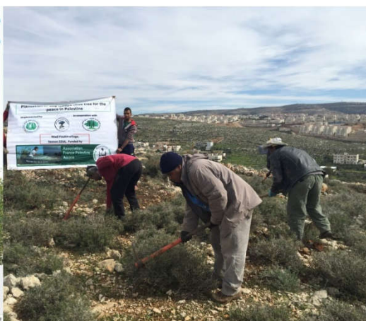
Plantation des oliviers