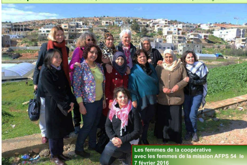
Les femmes de la coopérative avec les femmes de la mission AFPS 54 le 7 février 2016

La coopérative de femmes pour la création d'un atelier de transformation de produits agricoles