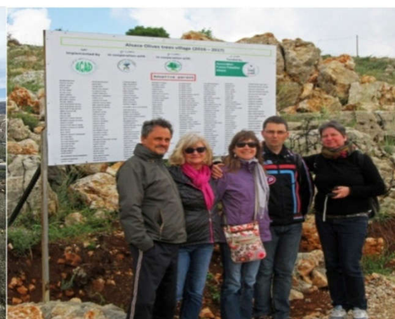
devant le verger, le panneau d'entrée avec la liste des premiers souscripteurs