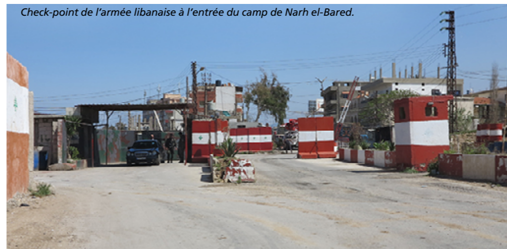
Check-point de l'armée libanaise à l'entrée du camp de Nahr el-Bared.