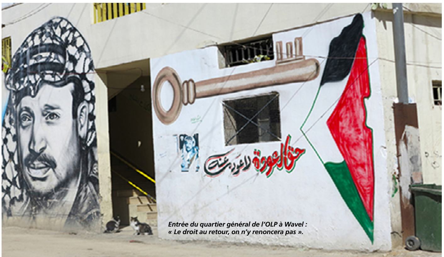
Entrée du quartier général de l'OLP à Wavel : « Le droit au retour, on n'y renoncera pas ».