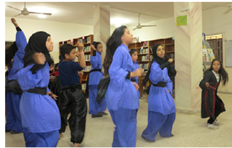
Répétition de Dabkeh au centre de Najdeh à Ain el-Hilweh.