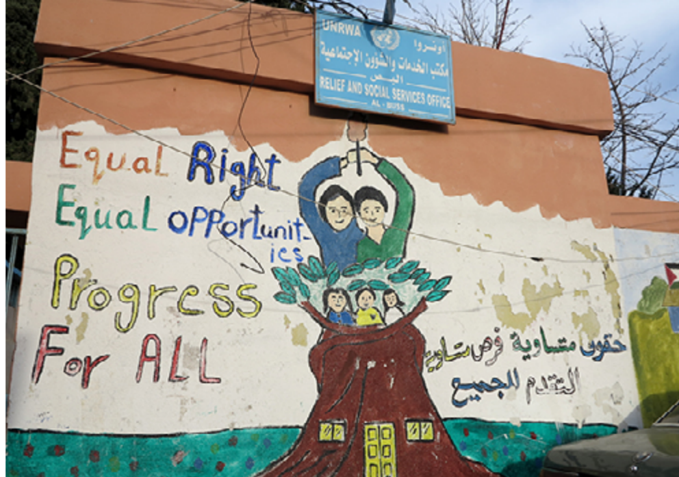
Le mur d'une école de l'UNRWA du camp de Ain el-Hilweh.

Le commerce reste le domaine privilégié dans les camps, l'activité artisanale ayant fortement baissé depuis l'interdiction par les autorités libanaises de faire entrer des matières premières, telles du bois, du fer, etc. En conséquence, ces professions sont exercées sans autorisation en dehors des camps et les ateliers peuvent à tout moment être fermés. Avec le temps les compétences se perdent et sont pas transmises aux plus jeunes. Cette poli-