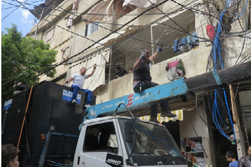
Passage difficile d'un camion sous les fils électriques au camp de Burj-el Barajneh. Les tuyaux bleus alimentent les appartements en eau...