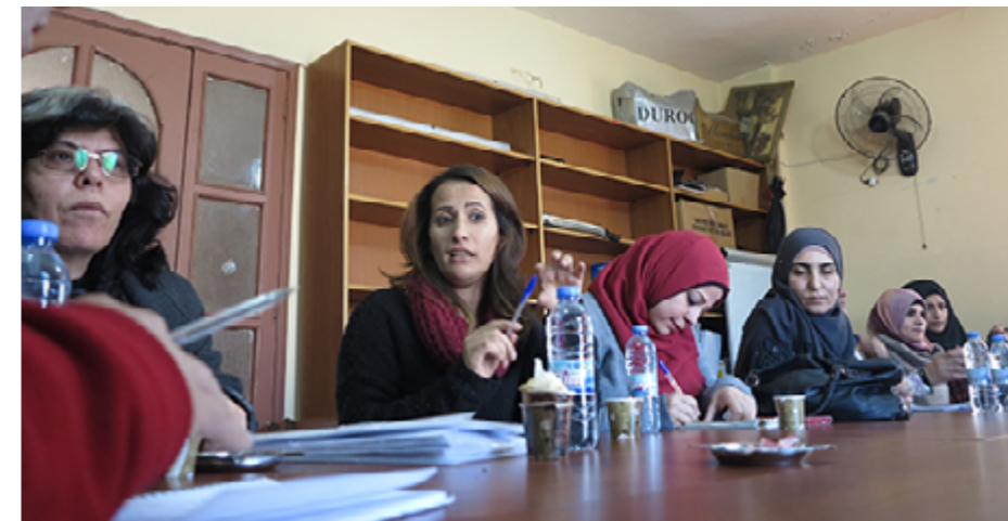
Réunion de jeunes femmes de Najdeh au camp de Nahr el-Bared.

Des associations comme Najdeh et Beit Atfal el-Sumoud ne mettent plus en avant leur affiliation politique initiale, FDLP pour la première et Fatah pour la seconde 4 . « Dans le but d'aborder les questions identifiées comme sociales, les acteurs se sentent obligés de les étiqueter comme apolitiques, ou non-partisanes : la pression vient des bailleurs de fonds et du public » 5 . Pour autant, la part grandissante des ONG dans la gestion quotidienne des services dans les camps et la professionnalisation de leurs équipes, que nous avons pu effectivement constater, correspondrait à une forme différente d'engagement, dans laquelle les jeunes