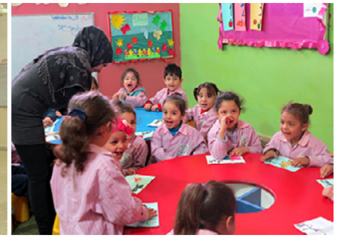
Le jardin d'enfants de Najdeh au camp de Beddawi.

ONG force l'admiration, tout comme leur faculté à poursuivre leur travail malgré les obstacles considérables.