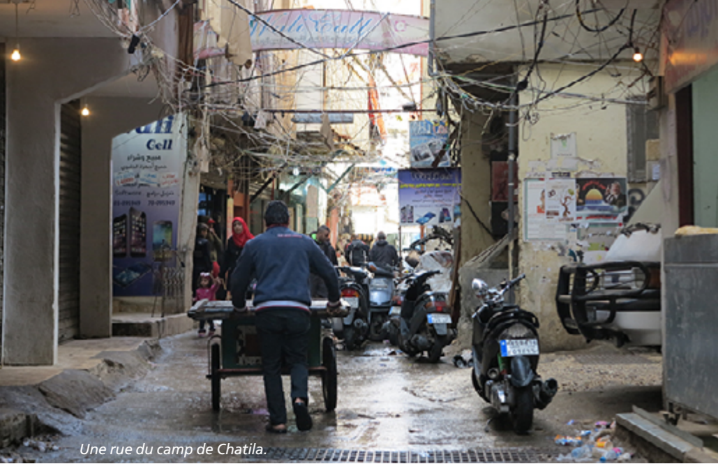
Une rue du camp de Chatila.