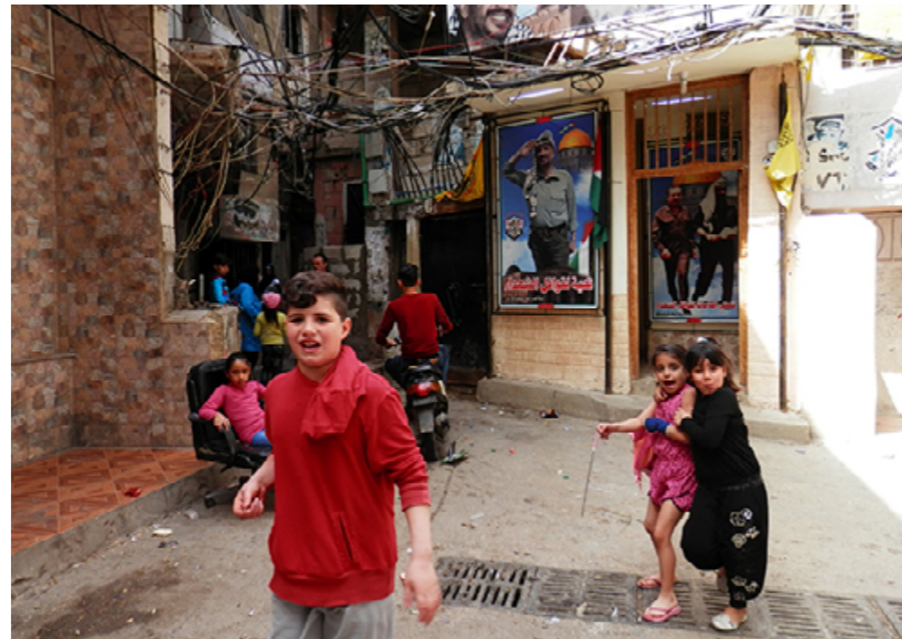
Jeunes réfugiés dans une ruelle devant le QG du Fatah-OLP à Burj el-Barajneh.

Nos partenaires palestiniennes, Najdeh, Beit Atfal as-Sumoud et Ajial, tout comme les associations libanaises Al-Ghad et Amel 1 que nous avons également rencontrées, font l'impossible avec des moyens limités. Qu'il s'agisse d'éducation ou de santé, notamment de santé psychique, dans les centres qu'ils ont établis dans tous les camps, ils tentent de produire les services indispensables à une population qui vit dans l'insalubrité, dans des conditions sanitaires et médicales à la limite de la survie. Ils se focalisent essentiellement sur les femmes et les enfants, particulièrement vulnérables. L'engagement du personnel et des volontaires de ces