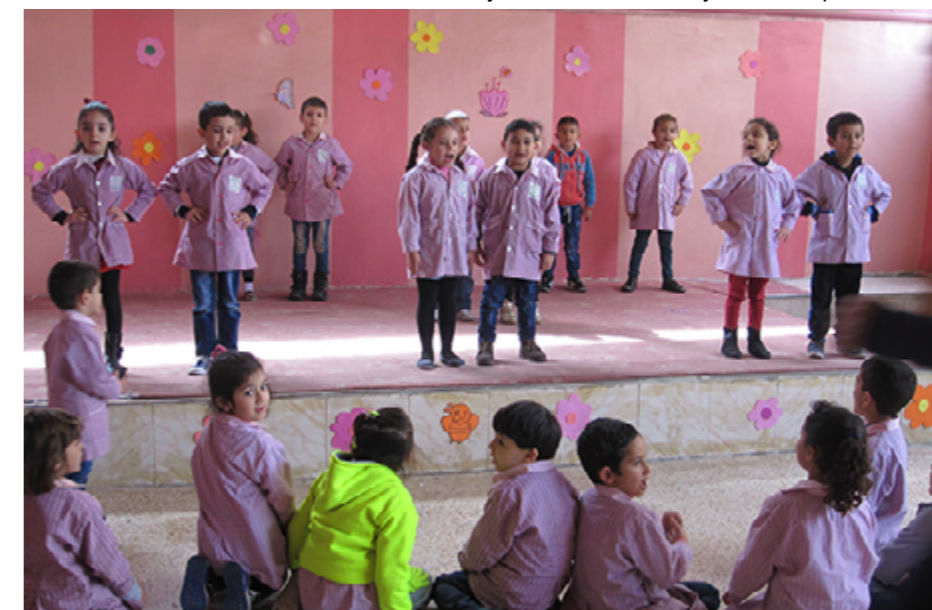
Le jardin d'enfants de Najdeh au camp de El-Buss.

Le désengagement de l'UNRWA, estiment nos partenaires unanimes, n'est ni un hasard ni une fatalité. L'agence n'existe que tant que le dos-