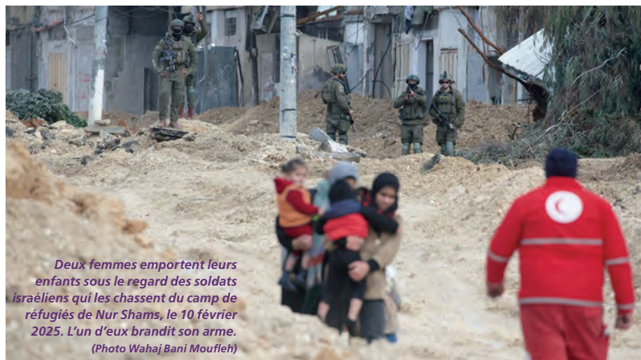
Deux femmes emportent leurs enfants sous le regard des soldats israéliens qui les chassent du camp de réfugiés de Nur Shams, le 10 février 2025. L'un d'eux brandit son arme.

Depuis lors, ce concept a été intégré dans un certain nombre de traités internationaux et dans le Statut de Rome de la CPI 4 auquel a accédé l'État de Palestine en 2015. Selon ce Statut de Rome, la déportation ou le trans-