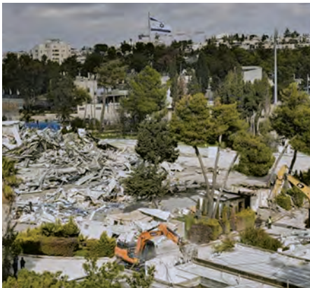
Tractopelles et bulldozers CAT sont arrivés, mardi 20 janvier au petit matin, sans avertissement, au cœur du quartier Cheikh Jarrah, pour démolir le siège de l'Unrwa, partiellement détruit puis incendié.