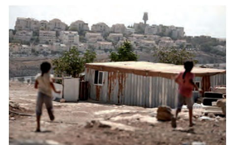
Enfants Bédouins de Jabal al-Baba, face à la colonie de Ma'ale Adumim.