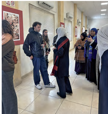
Présentation de la bande dessinée au camp de Zarqa, en Jordanie, le 12 avril 2025.

Une bande dessinée qui témoigne de la transmission intergénérationnelle de l'identité palestinienne et réaffirme le droit au retour.