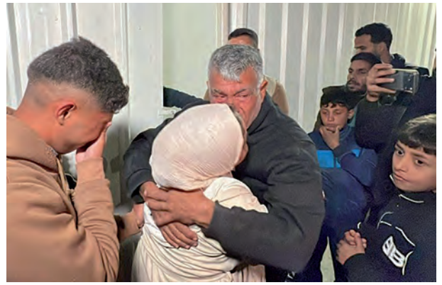
Le 12 février 2026, dans la bande de Gaza, des Palestiniens rentrant d'Égypte sont accueillis à leur arrivée au point de passage de Rafah.