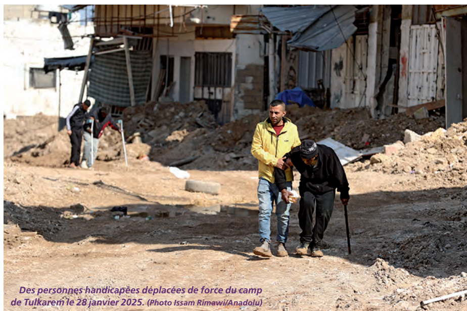
Des personnes handicapées déplacées de force du camp de Tulkarem le 28 janvier 2025.

Pour qualifier les crimes commis par Israël envers les Palestiniens, il est important de se référer à des définitions juridiques qui en assurent la réalité et permettent, le moment venu, de les introduire dans des procédures de juridictions internationales, de poursuivre et d'en condamner les auteurs. C'est dans ce sens qu'un rapport sur les crimes commis par Israël dans trois camps de réfugiés de Cisjordanie, intitulé « All My Dreams Have Been Erased », publié le 20 novembre 2025 par Human Rights Watch, a toute son importance.