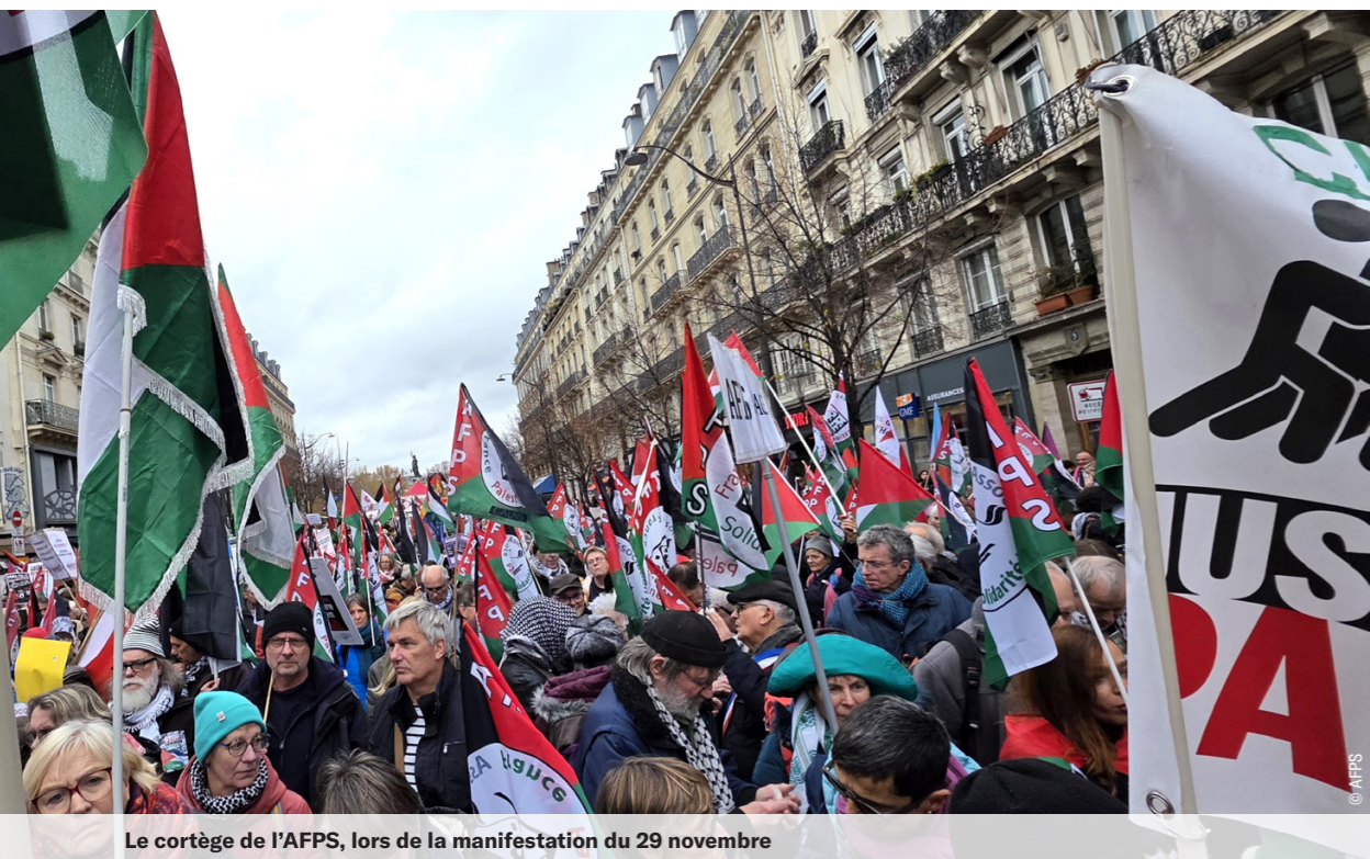
Le cortège de l'AFPS, lors de la manifestation du 29 novembre

Nous espérions tous et toutes un succès immense. Une inquiétude planait pourtant. Sur le nombre de participants bien sûr, mais aussi en raison de la météo : la pluie était annoncée depuis plusieurs jours. Manifester ce 29 novembre, c'était un double pari!