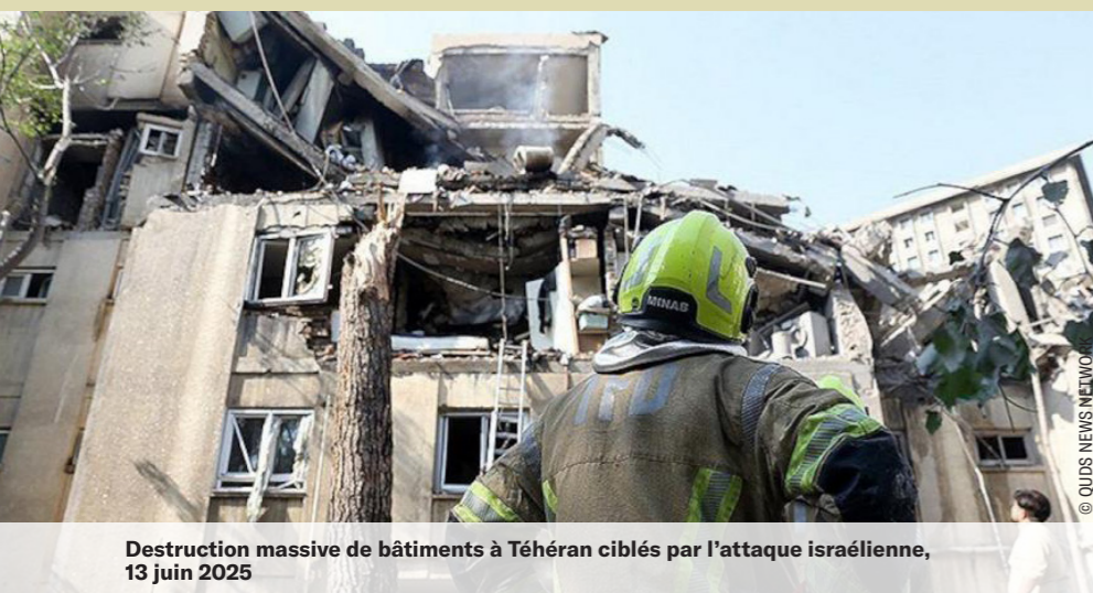
Destruction massive de bâtiments à Téhéran ciblés par l'attaque israélienne, 13 juin 2025