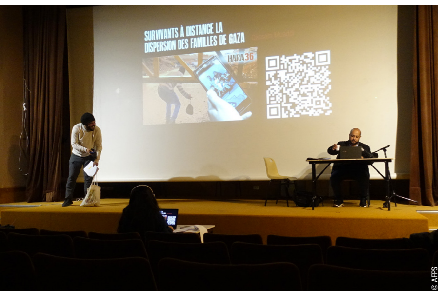
Pendant la performance « la Palestine narrée » d'Hara 36 aux Mées (04) le 23/11/25