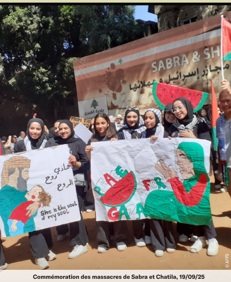
Commémoration des massacres de Sabra et Chatila, 19/09/25

du Proche-Orient dans laquelle l'État juif remonte jusqu'à la rivière Awali, au nord de Saïda. Étrangement, un peu plus d'un siècle plus tard, depuis octobre 2023, le gouvernement Netanyahu multiplie les initiatives pour vider le sud-Liban de sa population : villages détruits, champs phosphorés, oliviers brûlés, etc.