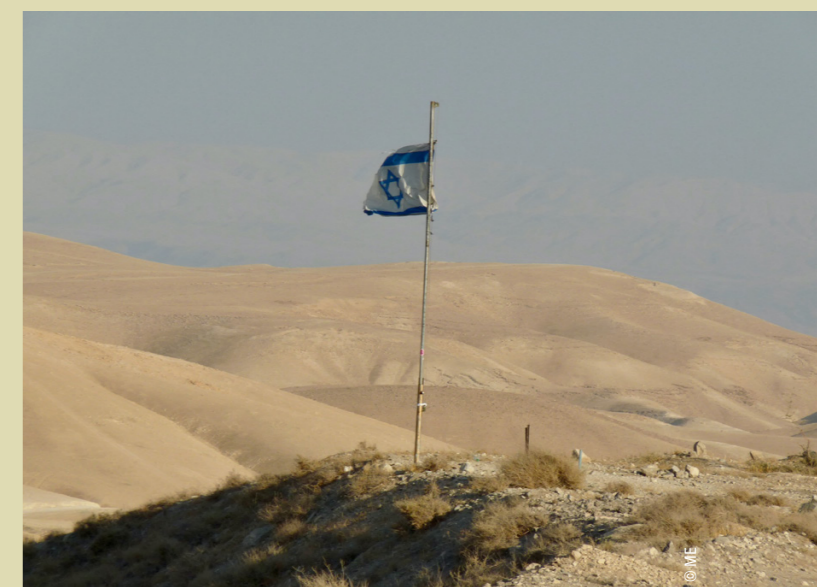
Avant-poste, Khan El Ahmar

Conseillé et assisté par son gendre Jared Kushner et par son ami le détenteur de l'empire immobilier Steve Witkoff qu'il a nommé envoyé spécial pour le Moyen-Orient, Donald Trump assume donc l'inhumation du droit international dont il ne fait nulle mention, au profit de la loi conquérante du plus fort. Il passe outre le droit des peuples à l'autodétermination et toutes les résolutions des Nations unies et de son Conseil de sécurité, à commencer par les résolutions 242 et 338 qui réaffirment l'inadmissibilité de l'acquisition de territoires par la force et la résolution 194 qui prévoit le retour et le dédommagement des réfugiés palestiniens expulsés de chez eux depuis près de huit décennies. Il exclut toute référence à l'arrêt de la Cour internationale de Justice de juillet 2024 laquelle rappelait que « L'État d'Israël est dans l'obligation de mettre fin à sa présence illicite dans