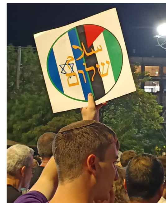
Coexistence pour la paix lors de la commémoration de l'assassinat d'Y. Rabin. Une petite lueur d'espoir.