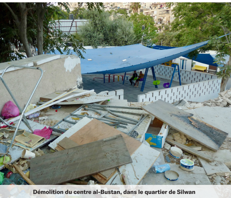
Démolition du centre al-Bustan, dans le quartier de Silwan

La pleine lune éclaire cette nuit de novembre, éclipsant presque les lumières de la ville de Yatta, au loin dans les collines du sud d'Hébron. Nous sommes trois accompagnateurs à nous relayer pour des tours de garde afin d'alerter au cas où les colons viendraient attaquer la ferme de Moussa. Cela fait des mois qu'il veille, jour et nuit, qu'il ne dort quasiment plus. Il a installé un lit de camp dehors sous l'auvent. Allongé, il épie les bruits de la nuit. Notre présence le rassure un peu et il peut s'endormir mais il reste toujours sur le qui-vive. Cette nuit sera calme;