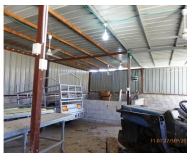
Extérieur et intérieur du local pour la ligne de conditionnement