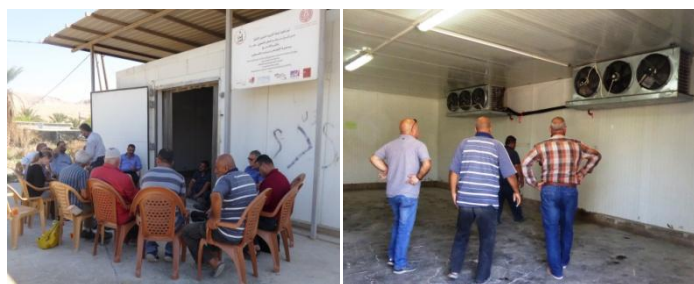
Chambre froide : intérieur et extérieur

Une action de formation des membres de la coopérative a été engagée depuis début 2018 et se poursuivra pour accompagner la coopérative dans cette phase de développement.