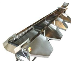
Modèle de machines de lavage et de tri

Le local est trouvé, avec une bonne alimentation électrique. Il nécessite des travaux de mise aux normes à effectuer par la coopérative. L'AFPS fournira les machines qui seront achetées à des entreprises palestiniennes.