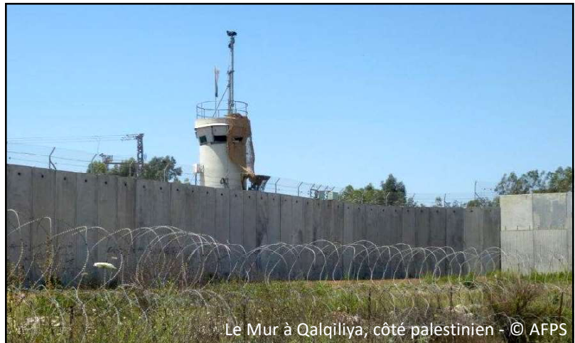
Le Mur à Qalqiliya, côté palestinien

Le Mur se développe sur 780 km, soit le long de la « ligne verte » (ligne d'armistice de 1949 de 315 km), soit très à l'intérieur du territoire de la Cisjordanie, volant près de 10% de leurs terres aux Palestiniens. Construit à partir de 2002, il est quasiment achevé aujourd'hui. En réalité, il était pensé bien avant 2000, année de la Seconde Intifada.