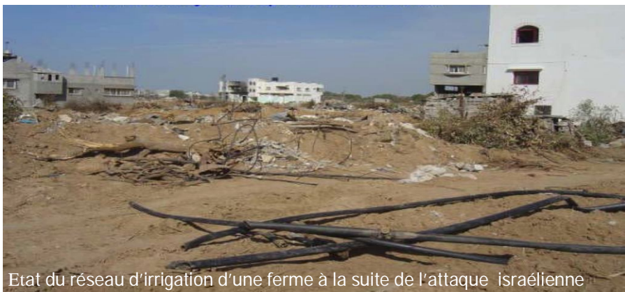
Etat du réseau d'irrigation d'une ferme à la suite de l'attaque israélienne

A envoyer à Monsieur Daniel BERTHET, 4 chemin des Rouquets - 04000 - DIGNE