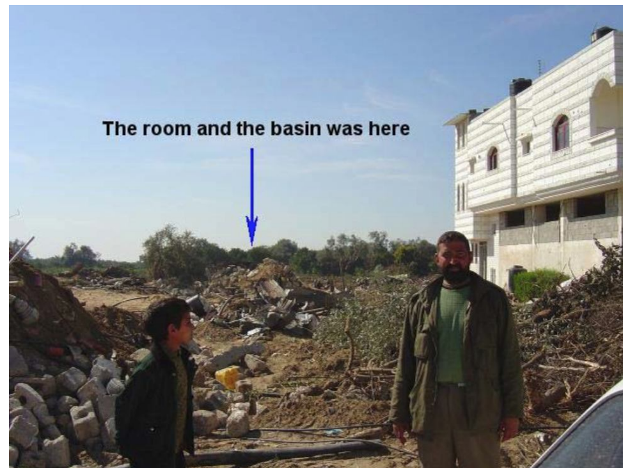
Bâtiments destinés à l'irrigation détruits après l'agression israélienne