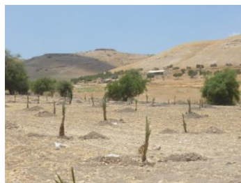
Plantations juin 2013 près de la source

Ceux qui ont survécu (150) sont en bon état mais en retard de développement pour un certain nombre. Un programme pour aider les fermiers va être mis en place début 2015 avec un accompagnement sur place.