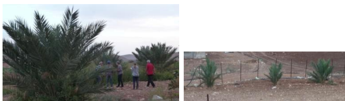
2 parcelles à Al Malih plantées en 2012

Ceux qui ont survécu (150) sont en bon état mais en retard de développement pour un certain nombre. Un programme pour aider les fermiers va être mis en place début 2015 avec un accompagnement sur place.