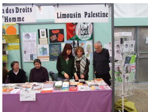
Lire à Limoges

Le CA se réunit une fois par mois, environ.