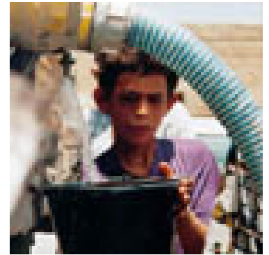
Restriction de l'eau