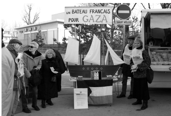
Sur le marché de la Monnaie à Romans

Sites Internet : www.unbateaupourgaza.fr et www.france-palestine.org