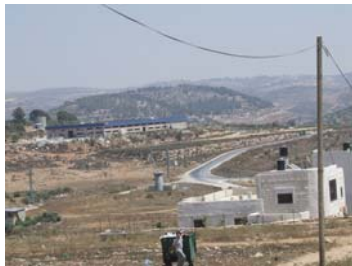
Chek point et colonies au loin en face de Nabi Salih près de Qarawat