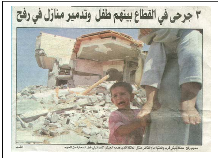
Le Liban. Al Quds, Jérusalem, 9 août 2006