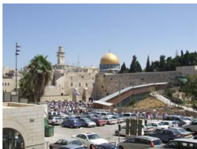
Jérusalem, été 2006

Projection du film « Notre histoire » présenté par Dr Mustafa Barghouthi