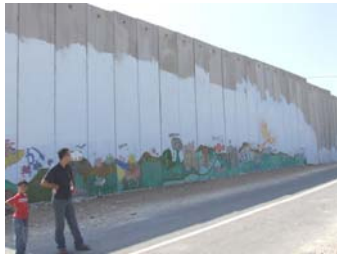
Le mur à Al Zawiyh

Si le projet abouti, l'Etat d'Israël contrôlera 60 % de la Cisjordanie dont l'ensemble de la vallée fertile du Jourdain