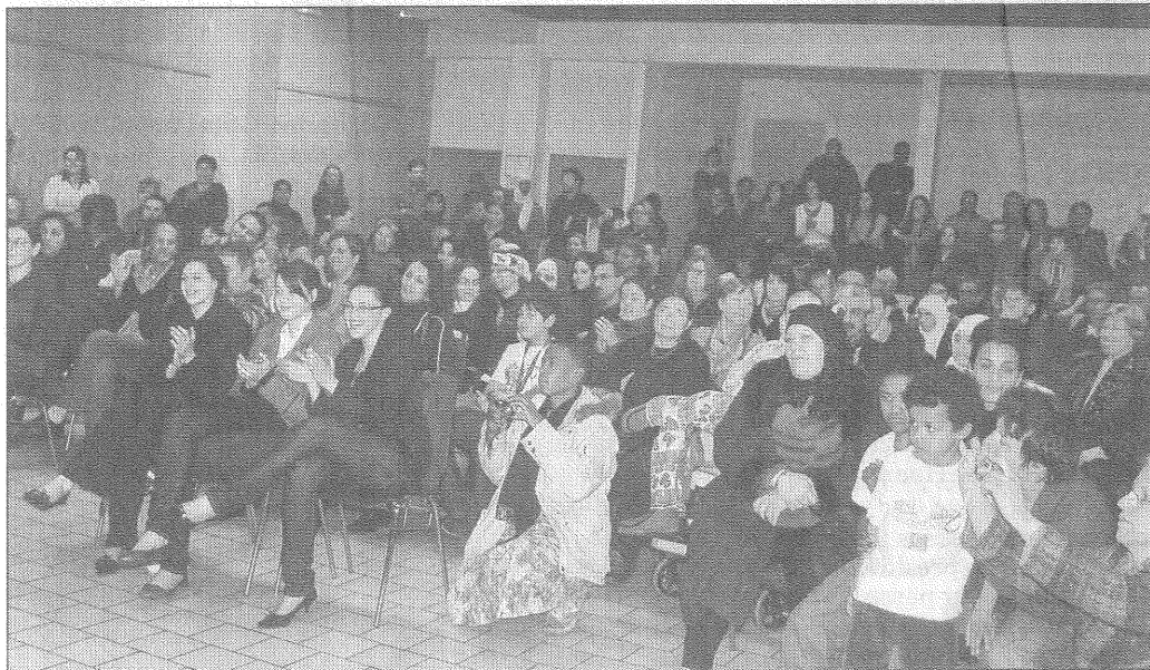
Le public a répondu à l'appel de l'association France Palestine Solidarité.