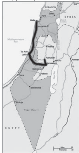
le voyage de Soraya et Emad