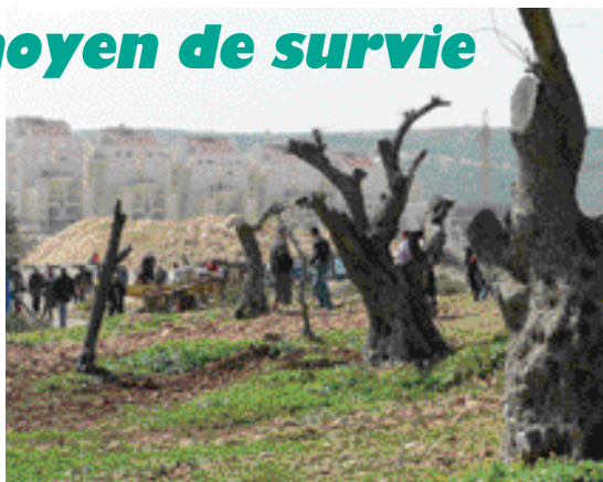
À Bil'in, les oliviers coupés pour l'extension des colonies et l'implantation du mur.

La production moyenne annuelle est de 15 000 tonnes (avec une importante variation pouvant aller de 5 000 tonnes/an à plus de 30 000 tonnes), soit 4 fois la production française, mais à peine 0,8 % de la production mondiale. La consommation locale étant de 7 000 à 10 000 tonnes, les olives et l'huile d'olive constituent un des principaux produits d'exportation de l'agriculture palestinienne.