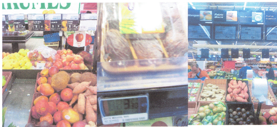
Grenades "Israël" Super U 16/09/2016

Quelques photos de produits donnés pour "israéliens" et vendus dans des grandes surfaces de Beauvais : aucun étiquetage spécifique n'a encore été mis en place alors que certains ont toute probabilité statistique de venir de la vallée du Jourdain ( Cisjordanie )