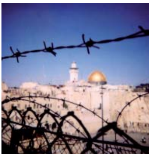
David Sauveur - agence VU