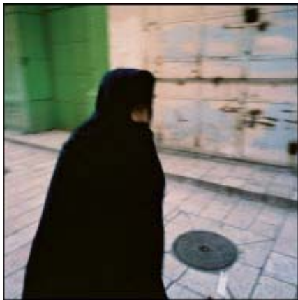
Denis Bourges < Tendance Floue