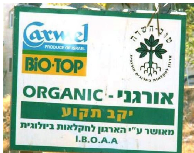
Texte en hébreu :

http://maps.google.fr/maps?f=q&source=s_q&hl=fr&geocode=&q=israel+roi&ll=31.046051,34.851612&sspn=6.595736,6.328125&q=israel&ie=UTF8&ll=32.247509,35.489481&spn=0.40709,0.395508&z=11