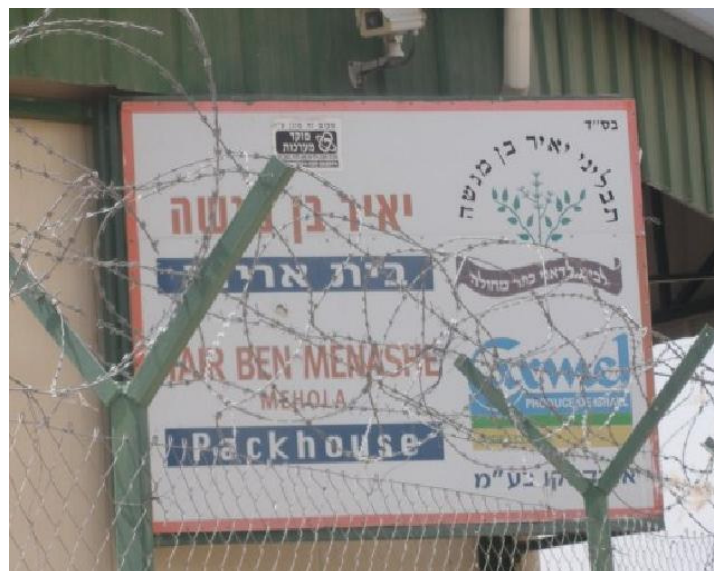
Photo prise le 4 Février 2009 dans la Vallée du Jourdain.