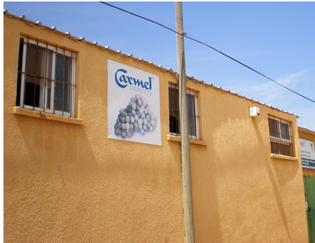
Colonie de Ro'i