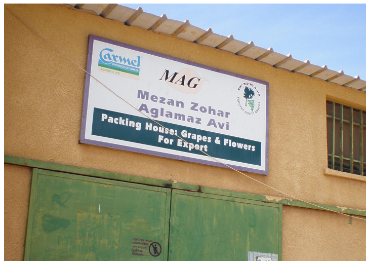
Lien Google Map colonie de Ro'i :

Entrepôt d'emballage de raisins et fleurs pour l'exportation