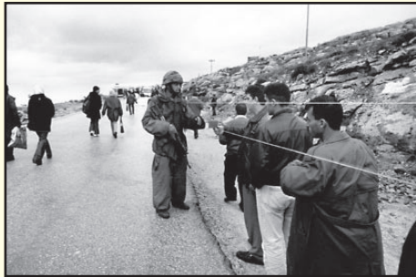
Barrière militaire à la sortie de Ramallah, vers Ayn Arik, déc. 2002.

Voici ce qu'écrit Ramzy Baroud en introduction de son livre : « La Deuxième Intifada palestinienne restera durablement gravée dans l'Histoire comme l'époque où les règles du jeu ont été profondément transformées. Cette période a connu le choc des nombreux jeunes qui se faisaient volontairement exploser ainsi que la honte de l'érection d'un des plus grands murs dans l'Histoire pour créer ainsi une séparation permanente entre deux peuples... »